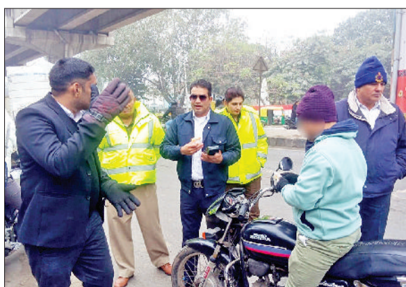
बहादुरगढ़। नियमों की अवहेलना पर वाहन चालक का चालान करती पुलिस।

दरअसल, गत आठ जनवरी को किला मोहल्ला स्थित एमएस ज्वेलर्स पर लूटपाट की बरपावट हो गई थी। तीन बदमाशों ने चाकू, पिस्तौल के बल पर वारदात की थी।