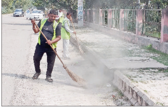
बहादुरगढ़। सड़क किनारे सफाई करते कर्मचारियों का फाइनल फोटो।

केंद्र सरकार द्वारा जारी स्वच्छता सर्वेक्षण के आंकड़ों में इस बार बहादुरगढ़ नगरपरिषद का रैंक