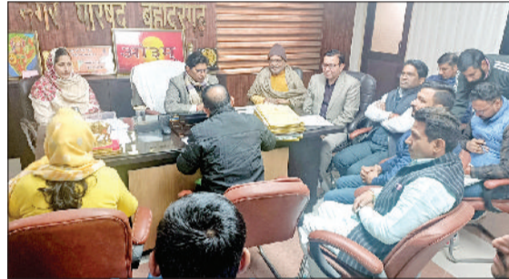
बहादुरगढ़। पेमेंट अप्रुवल कमेटी की बैठक में चर्चा करते अधिकारी व पार्षद।

पेयमेंट अप्रुवल कमेटी की बैठक में क्लीनिंग एंड स्वीपिंग के लिए गणेश एंटरप्राइज को एक महीने के 1 करोड़ 59 लाख 59 हजार 392 रुपए और नालों की सफाई के लिए आईएनडी