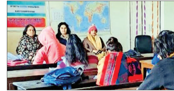
बहादुरगढ़। निबंध प्रतियोगिता में भाग लेते विद्यार्थी।