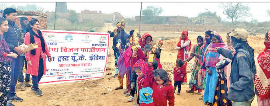
झज्जर। कार्यक्रम के दौरान बच्चों में इम्युनिटी बूस्टर किट करते हुए संस्था सदस्य।

सेवा ट्रस्ट यूके इंडिया तथा इंडियन विजन फाउंडेशन द्वारा वीरवार को देश के पूर्व प्रधानमंत्री स्वर्गीय लाल बहादुर शास्त्री की पुण्यतिथि के उपलक्ष्य में छारा रोड स्थित ईट भट्टा पर कार्यक्रम का आयोजन कर प्रवासी मजदूरों को शिक्षा के महत्व से अवगत कराया गया। कार्यक्रम के दौरान संस्था सदस्यों ने लाल बहादुर शास्त्री के जीवन पर प्रकाश डाला