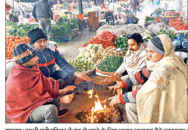
झज्जर। सज्जी मंडी परिसर में टंड से बचने के लिए अलाव जलाकर बैठे दुकानदार।