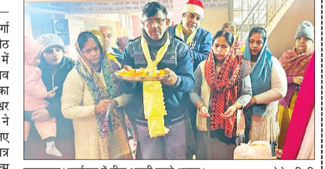
बहादुरगढ़। कार्यक्रम में गीता आरती करते श्रद्धालु।