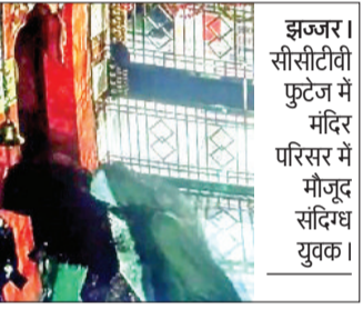
झज्जर। सीसीटीवी फुटेज में मंदिर परिसर में मौजूद संदिग्ध युवक।