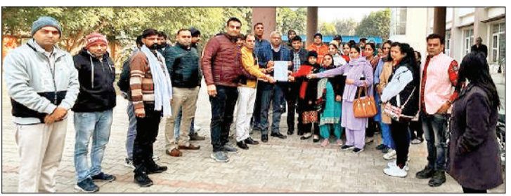
झज्जर। सीएमओ कार्यालय परिसर में कार्यालय प्रतिनिधि को ज्ञापन सौंपते हुए एनएचएम कर्मचारी।

यूनियन के जिला प्रधान ने कहा कि यदि उनकी मांगें शीघ्र पूरी नहीं की गईं तो प्रदेश सरकार के खिलाफ प्रदर्शन करने पर मजबूर होंगे।