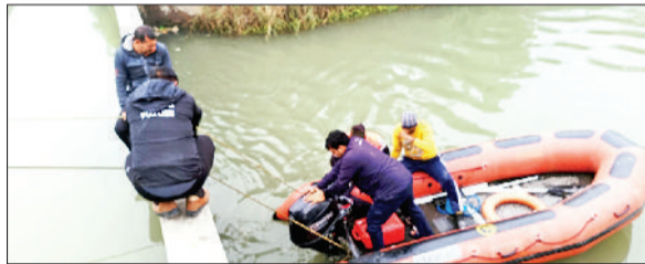
बहादुरगढ़। शव को निकालने के प्रयास में जुटी गोताखोर टीम।