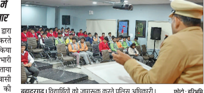
बहादुरगढ़। विद्यार्थियों को जागरूक करते पुलिस अधिकारी।