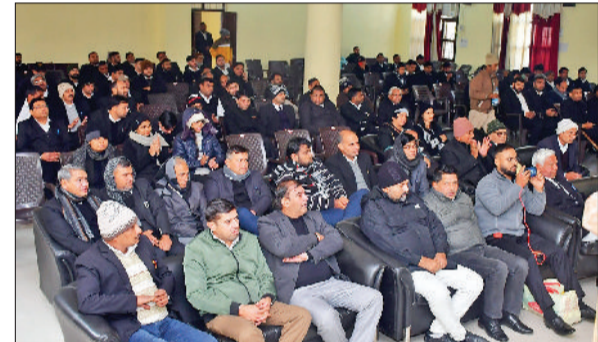
झज्जर। कार्यक्रम में मौजूद अधिकारता।

लोहारहेड़ी में दंगल व मंडारा 14 को बहादुरगढ़। लोहारहेड़ी में 14 जनवरी को तीसरे विशाल इनामी कुश्ती दंगल व मंडारा का आयोजन होगा। इसमें पहला इनाम सवा लाख, दूसरा इनाम 81 हजार व तीसरा इनाम 51 हजार है। अन्य पहलवानों को इनाम देकर प्रोत्साहित किया जाएगा।